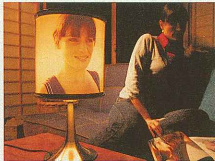
Stilvoll: ein eigener Foto-Lampenschirm

Gerade in der dunklen Jahreszeit sind es kleine Dinge, die erhellend wirken. Etwas im wahrsten Sinne des Wortes Erhellendes liefert die Internetplattform www.fotokasten.de mit ihren individuell gestaltbaren Lichtquellen. Ob nur den Lampenschirm (4,99 Euro) oder gleich die ganze Lampe (34,99 Euro) – beides kann man komfortabel online mit eigenen Fotos versehen. Zudem lassen sich die Bilder problemlos austauschen, damit das leuchtende Erinnerungstück auch immer aktuell bleibt. Bei der Lampe sorgt ein Dimmer mit drei Helligkeitsstufen für die richtige Ausleuchtung des Fotos.